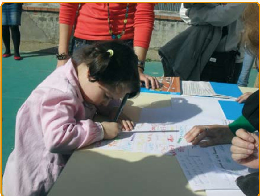
El Colegio nº 7 de Villarrobledo, Barranco Cafetero, se convirtió en Escuela Amiga de la Infancia, en abril de 2011.

Por otro lado Enrédate con UNICEF, continua con la labor de la promoción de la Educación para el Desarrollo, a través de sus materiales didácticos Salud para Todo el Mundo y las sesiones de formación en CPR de nuestra región. El Programa, que está consolidado en Castilla-La Mancha, se apoya, con actividades de sensibilización y movilización surgidas a partir de estos materiales, en los distintos centros de educación formal y no formal. Actividades como la celebración del “Día de los Derechos del Niño”, las carreras del Agua “Gotas para Níger” y festivales de Teatro infantiles y acciones como la firma de convenios con Escuelas Amigas de la Infancia o la formación del Consejo de Infancia de Guadalajara, entre otras, contribuyen a la implicación de la infancia y de su entorno, en la defensa de la educación en valores.