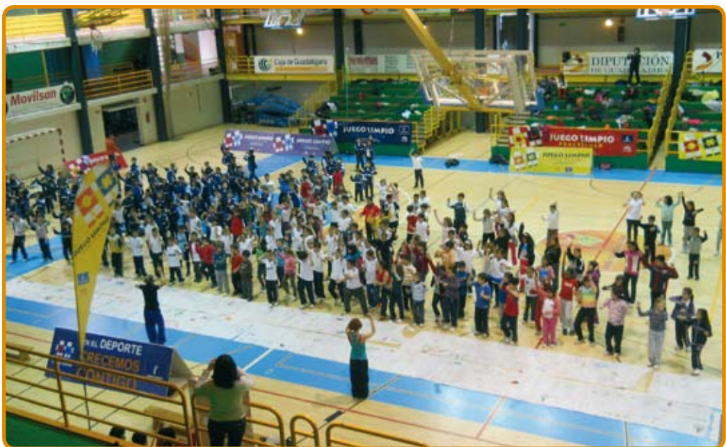
© UNICEF Comité Castilla-La Mancha/2011 Durante el curso escolar, se han desarrollado encuentros Juego Limpio por la región.